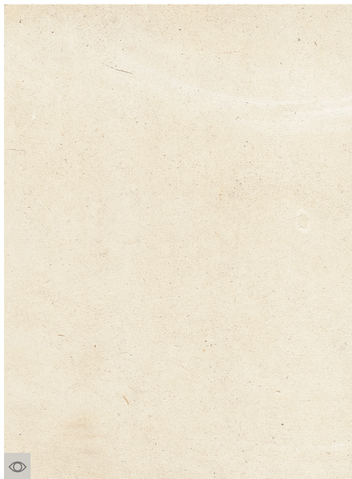
Auberge de jeunesse, Tours