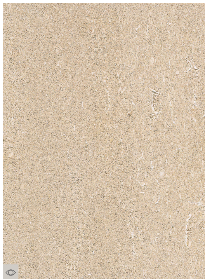
Royal champagne, Champillon