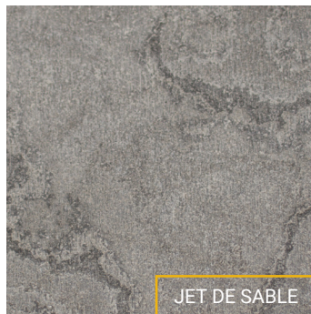
JET DE SABLE