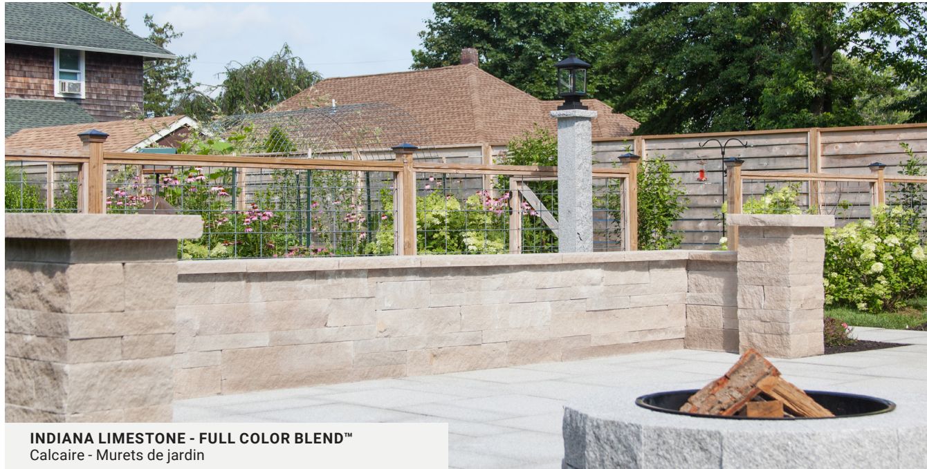
INDIANA LIMESTONE - FULL COLOR BLEND™ Calcaire - Murets de jardin

Les murets de jardin apportent une touche décorative unique à tout aménagement. Bien qu'ils ne soient pas conçus pour servir de soutènement, ces produits peuvent être empilés à sec et sont parfaits pour délimiter les platebandes et pour l'aménagement paysager.